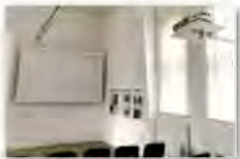
Neuer Projektor mit Leinwand im Vortragsraum

Pünktlich zu den beiden Veranstaltungen der „Langen Nacht des Museums“ im November montierten wir einen geschenkten Beamer samt hochwertiger Projektionsleinwand neue Technik in unserem Vortragsraum, die sich gleich bewährte.