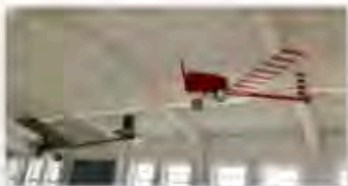
Flugdrone Nachbau M 1:1

Im Juli konnten wir durch den Nachbau und die Leihgabe zweier Drohnen (M 1:1) ein weiteres Erprobungsfeld der ehemaligen Erprobungsstelle thematisieren.