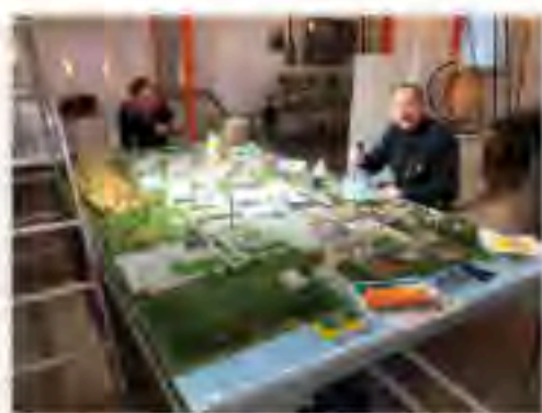
Arbeiten am Diorama der Schiffwerft Rechlin