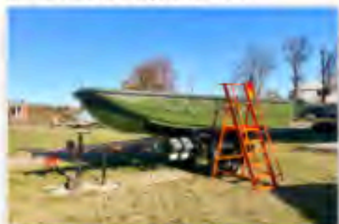
Rettungs- und Sicherungsboot RuSB auf seinem Anhänger

Ein weiterer Neuzugang – schon im letzten Jahr unserem Museum geschenkt – ist nun im Innenhof zu besichtigen. Das Rettungs- und Sicherungsboot RuSB mit seinem zugehörigen und angekauften Bootstrailer wurden aufwendig restauriert.