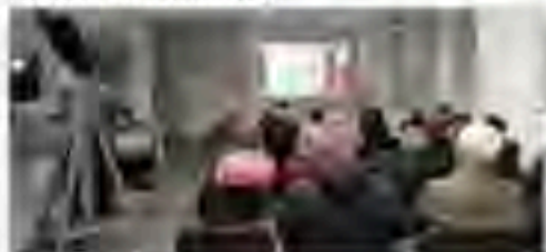
Lange Nacht des Museums

Von Mai bis Oktober und auf unserem Museumsfest engagierten sich wieder viele ehemalige KTS-Besatzungsmitglieder in Begleitung ihrer Ehepartnerinnen, um unseren Besuchern hautnah das Leben an Bord eines KTS-Bootes zu vermitteln.