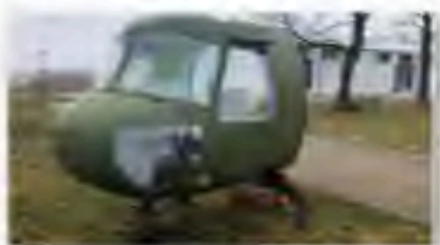
Mi-2 Cockpit für Kinder am Spielplatz

Im Juli konnten wir durch den Nachbau und die Leihgabe zweier Drohnen (M 1:1) ein weiteres Erprobungsfeld der ehemaligen Erprobungsstelle thematisieren.