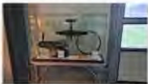
Vitrine zu Bodenfunden einer Ju 52

Noch im November gestaltete ein Vereinsmitglied eine neue Ausstellungsverglasung mit restaurierten Bodenfunden einer Ju-52 – einem Luftschraubengenerator und einer Peilantenne.