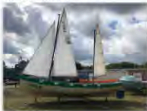
Ruder- und Segelkutter ZK-10

Kurz vor dem Museumsfest wurde uns mit dem Ruder- und Segelkutter ZK-10 ein neues Leihexponat mit Segeln von einem Vereinsmitglied übergeben, welches wir anlässlich des Festes auch gleich segelklar präsentierten. Es bereichert nun die Außenausstellung der ehemaligen Schiffswerft genauso wie die komplett überarbeiteten militärischen Schleppgeräte aus der Werftproduktion.