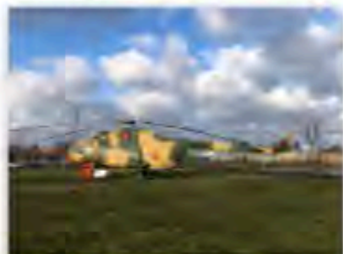
Hubschrauber Mi-8 nach seiner Restaurierung

Zum Herbst konnten drei Vereinsmitglieder die Restaurierung unseres Hubschraubers Mi-8 abschließen. Damit ist jetzt der zweite Hubschrauber für die Zukunft „gesichert“.