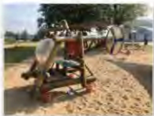
Spielhubschrauber auf erweitertem Spielplatz

In Vorbereitung der zukünftigen großen Veränderungen auf dem Museumsareal wurden bis Mai der bestehende neue Spielplatz erweitert und mit dem aufgearbeiteten Spielplatzhubschrauber bestückt. Ein weiteres Cockpitoriginal eines Mi-2 Hubschraubers wurde ebenfalls kindgerecht umgestaltet und auf dem Spielplatz aufgestellt. Seitdem bildet dieses Cockpit den Anlaufpunkt für Groß und Klein für schöne Erinnerungsfotos aus unserem Museum.