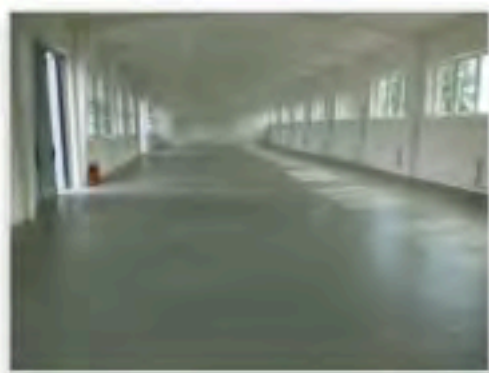
2023 - saniertes und erweitertes Museumsareal