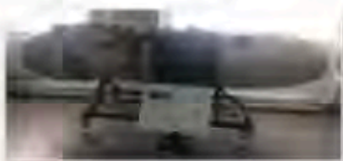
Strahltriebwerk Jumo 004

Leider mussten wir unsere Leihexponat des Deutschen Technikmuseums Berlin – das NSU-Kettenrad - wieder zurückgeben. So ist es nun einmal; wenn ein Leihgeber etwas aus welchen Gründen auch immer zurückverlangt, müssen wir als Leihnehmer diesem Wunsch entsprechen. Als Ersatz durften wir einen Wunsch anbringen und infolge im Gegenzug der Abholung ein Strahltriebwerk Jumo 004 entgegennehmen, über das wir uns sehr gefreut haben. Natürlich nutzten wir den Besuch des Leiters des Luftwaffenmuseums Berlin-Gatow während des Museumsfestes, um nach einem Ersatz des zurückgegebenen Kettenrades zu bitten. Dieser Bitte wurde unter Vorbehalt der Prüfung und Zustimmung durch die Sammlungskommission in Berlin entsprochen. Wir hoffen auf Zugang des Kettenrades Anfang 2024.